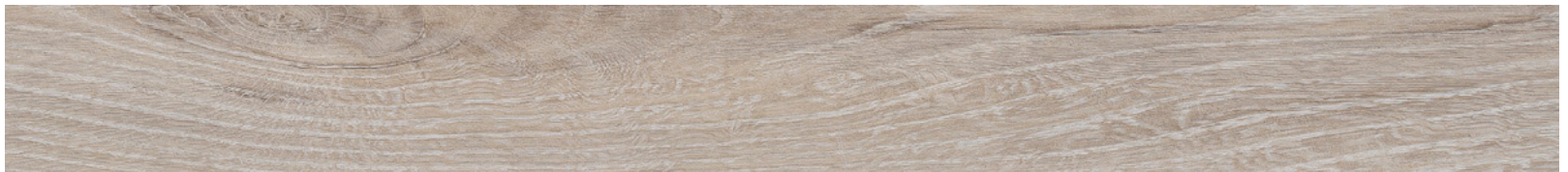
24169693 - Napoli