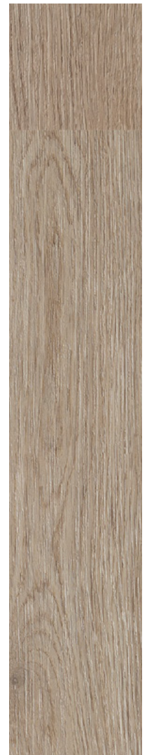
24169662 - Bergamasco